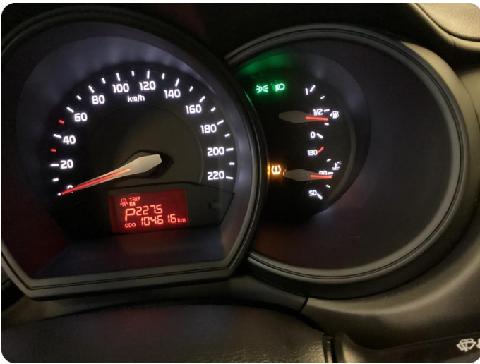
1.1 Däcktrycksvarnare lyser