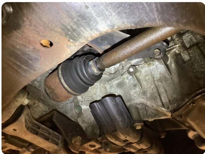
5.1 Läckande packning Höger fram drivaxel