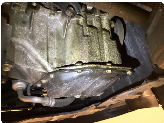
3.2 Övrigt fel Oljeläckage