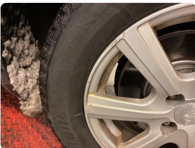
2.4 Kantstött fälg