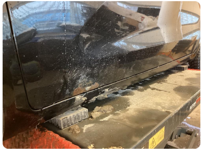
2.1 Rost/ korrosion