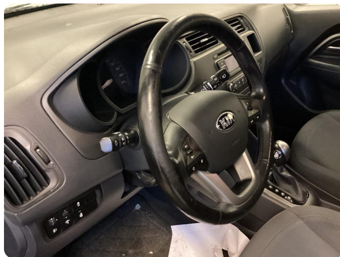
6.2 Slitet Låter konstigt när man vrider på ratten