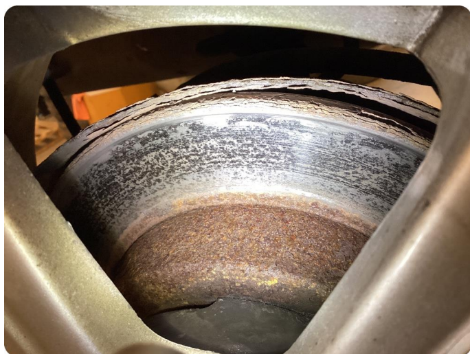
4.1 Slitna bromsskivor och -belägg Missljud vid inbromsning