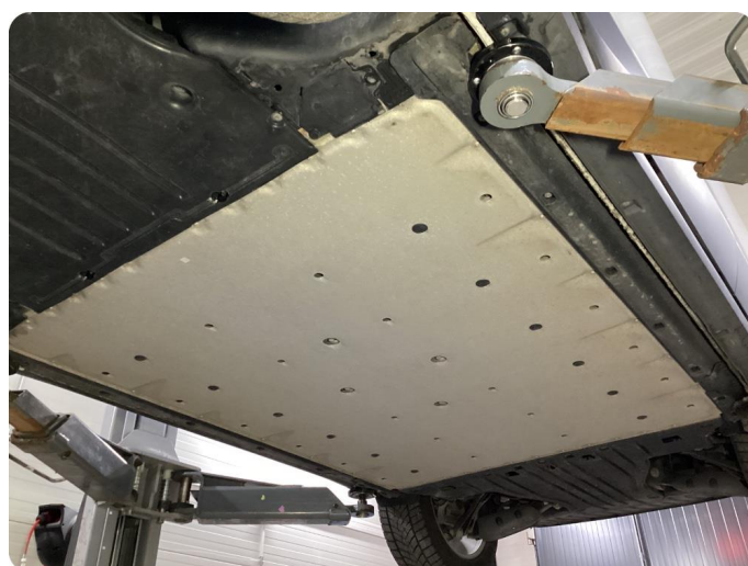
HV-Batteri i fint skick.