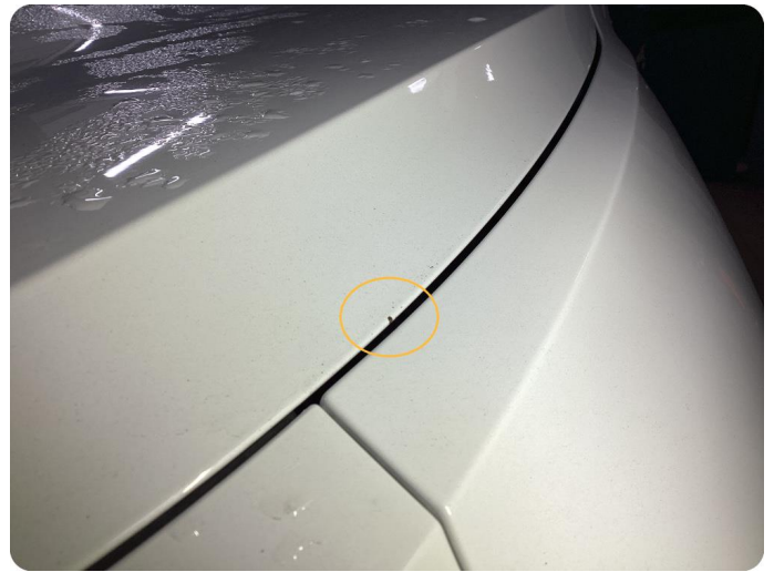
1.1 Övrigt fel Diverse små stenskott i fronten.