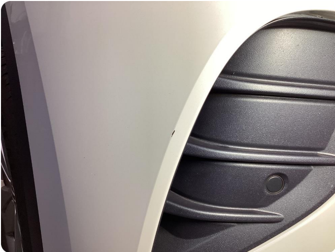
1.1 Övrigt fel Diverse små stenskott i fronten.