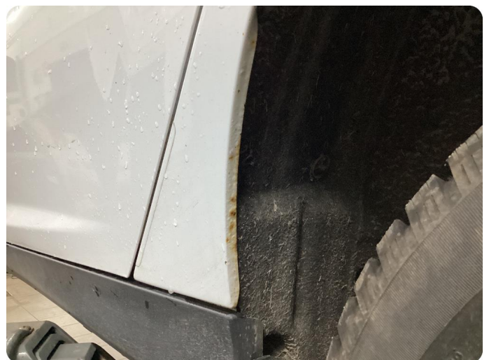
1.1 Generellt mycket slitgage Runt om bilen.