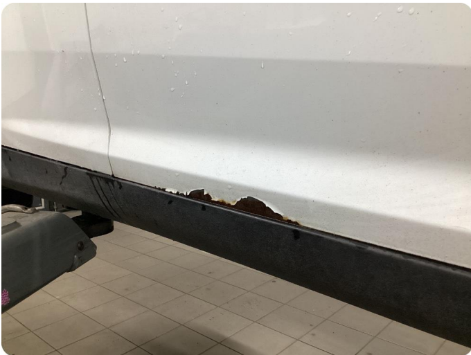
1.1 Generellt mycket slitgage Runt om bilen.