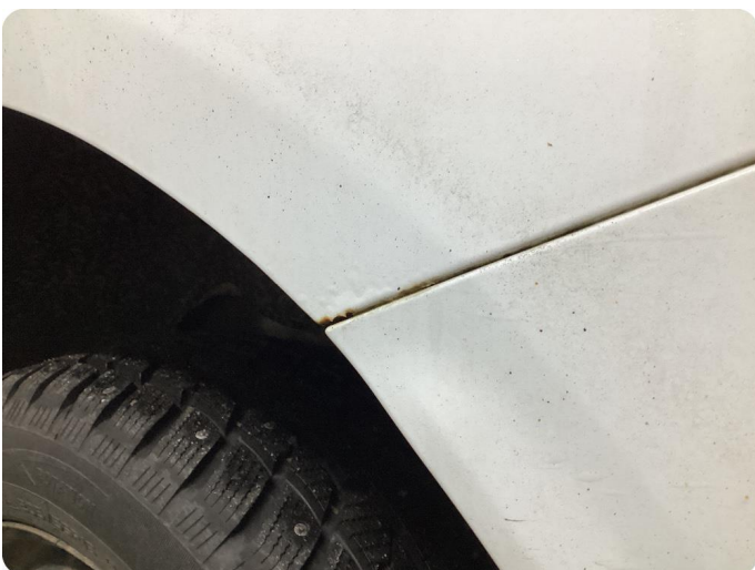
1.1 Generellt mycket slitgage Runt om bilen.