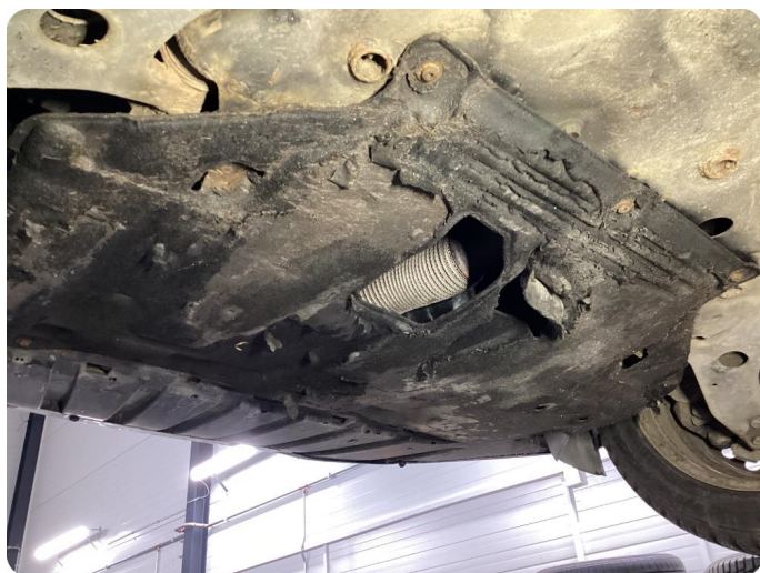
2.4 Övrigt fel Motorkåpa sliten.