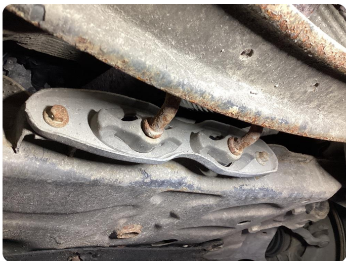
2.1 Övrigt fel Gummi fästen slitna.