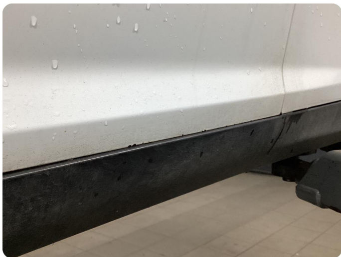
1.1 Generellt mycket slitgage Runt om bilen.