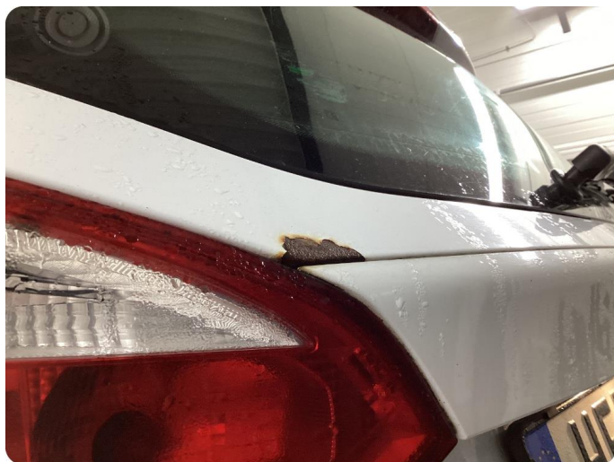
1.1 Generellt mycket slitgage Runt om bilen.