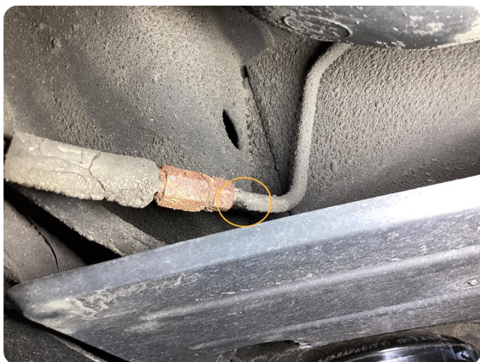
3.1 Övrigt fel Läckage i bromsrör.