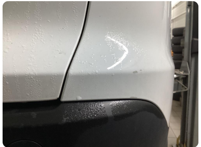
1.1 Generellt mycket slitgage Runt om bilen.