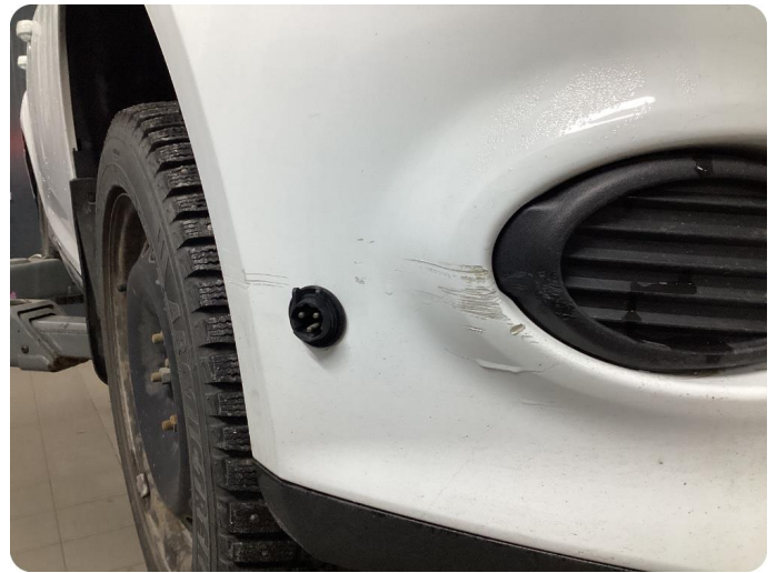
1.1 Generellt mycket slitgage Runt om bilen.