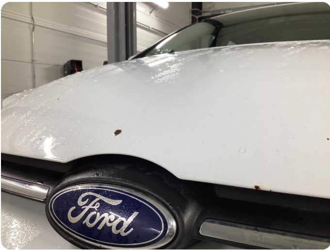
1.1 Generellt mycket slitgage Runt om bilen.